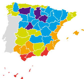
TRANSMITANCIA LIMITE UHLIM SEGÚN % DE HUECOS Y ORIENTACIÓN